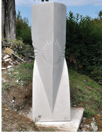
2010 ELENA SARACINO