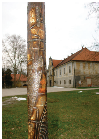
2006 ZDRAVKO JERKOVIČ