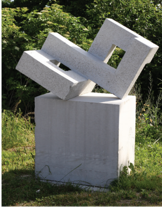
2009 STEFAN CURELARU