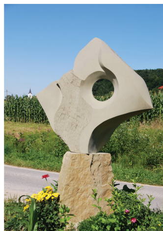
2008 HENK KORTHUYS