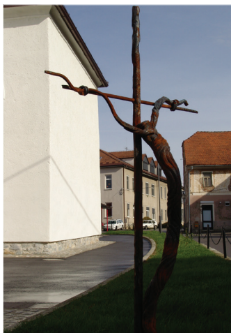
2004 MIHAEL KRIŠTOF