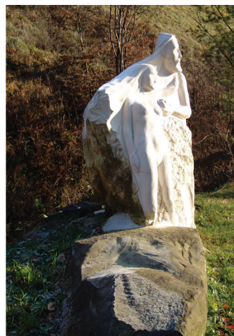
2005 FRANCI ČERNELČ