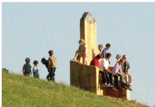
Pogled Branka Šmona

V osrčju znamenite makolske Poti forme vive, na njeni najvišji točki (400 m), se razprostira naravni Park skulptur Dežno s številnimi skulpturami in pogledom na še neokrnjeno lepoto narave. Pogled z najvišje točke parka, kjer je postavljena velikanska hrastova klop, delo nemškega kiparja Branka Šmona, je zares čudovit. Pogled je tudi ime Šmonove umetnine, ki sprejme na svoje sedišče okrog 10 ljudi in nudi razgled skoraj po vsej Dravinjski dolini vse do Maribora, Ptuja, Donačke gore, Slovenske Bistrice in Poljčan.