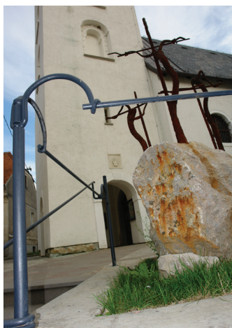
2007 MIHAEL KRIŠTOF