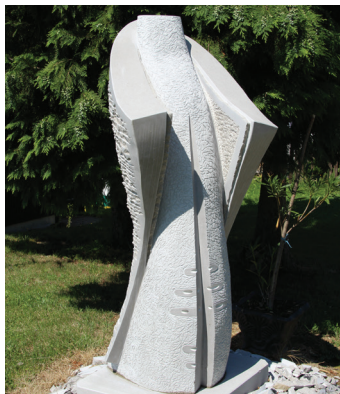
2015 - ARIEL ŠTRUKELJ