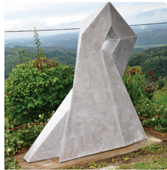
2014 - VALENTINO GIAMPAOLI