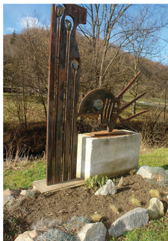
2003 TAPIWA CHAPO