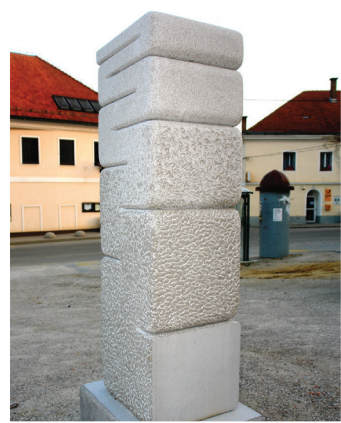
2011 TANYA PREMINGER