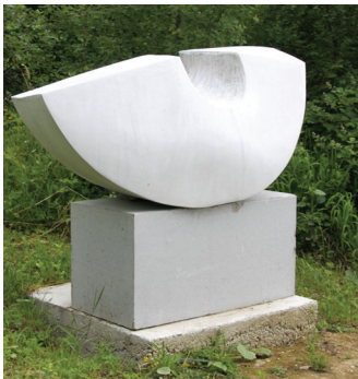
2013 - MAŠA PAUNOVIĆ