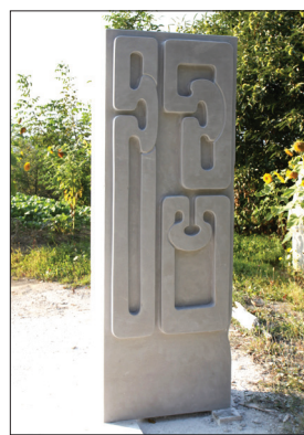
2016 - IVAN JEREMIĆ